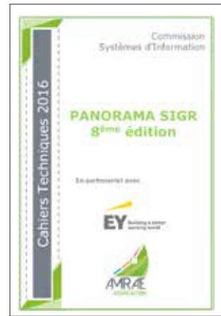
(disponible en français et en anglais)